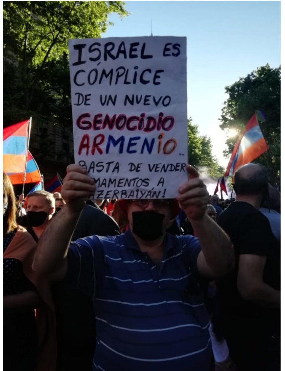
Movilización armenia en Buenos Aires hacia la embajada de Israel.