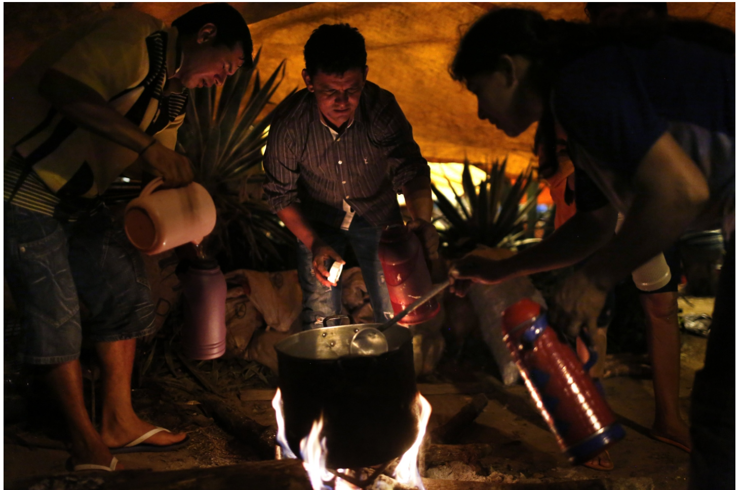
Campeños paraguayos en pie de lucha contra el gobierno y los latifundistas.

Allí no acaba la cosa. La familia Zavala figura en la larga lista de apellidos "honorables" de familias que se enriquecieron y recibieron cientos o miles de hectáreas de la mejor tierra del Paraguay, que iba destinada a planes agrarios. No se la merecían, no constituían sujeto de la reforma agraria, pero como eran prohijados del sanguinario dictador