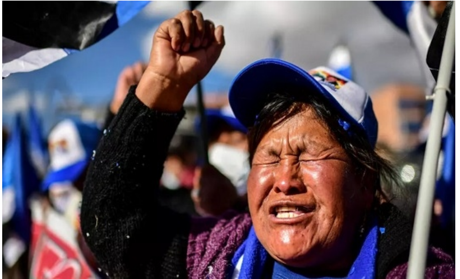
El pueblo boliviano votó con memoria histórica y para exigir que no se repitan errores.

Probablemente habrá dos etapas: una primera de carácter conservati-