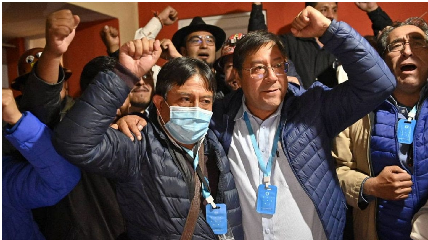
Lucho Arce con David Choquehuanca: esta vez es la oportunidad definitiva.

-Una cosa que suele suceder cuando una dictadura es derrotada, en este caso por la vía electoral, es que surgen por parte de los ganadores discursos pacificadores, de reconciliación. En este caso, ya David y también Lucho Arce han señalado: "nos