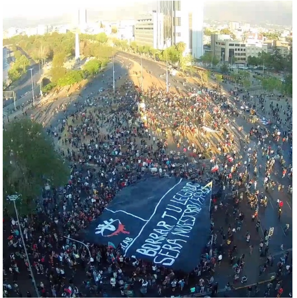
Plaza de la Dignidad el día de la victoria del Apruebo

incesante para que Piñera se vaya, el secreto es no soltar la calle.