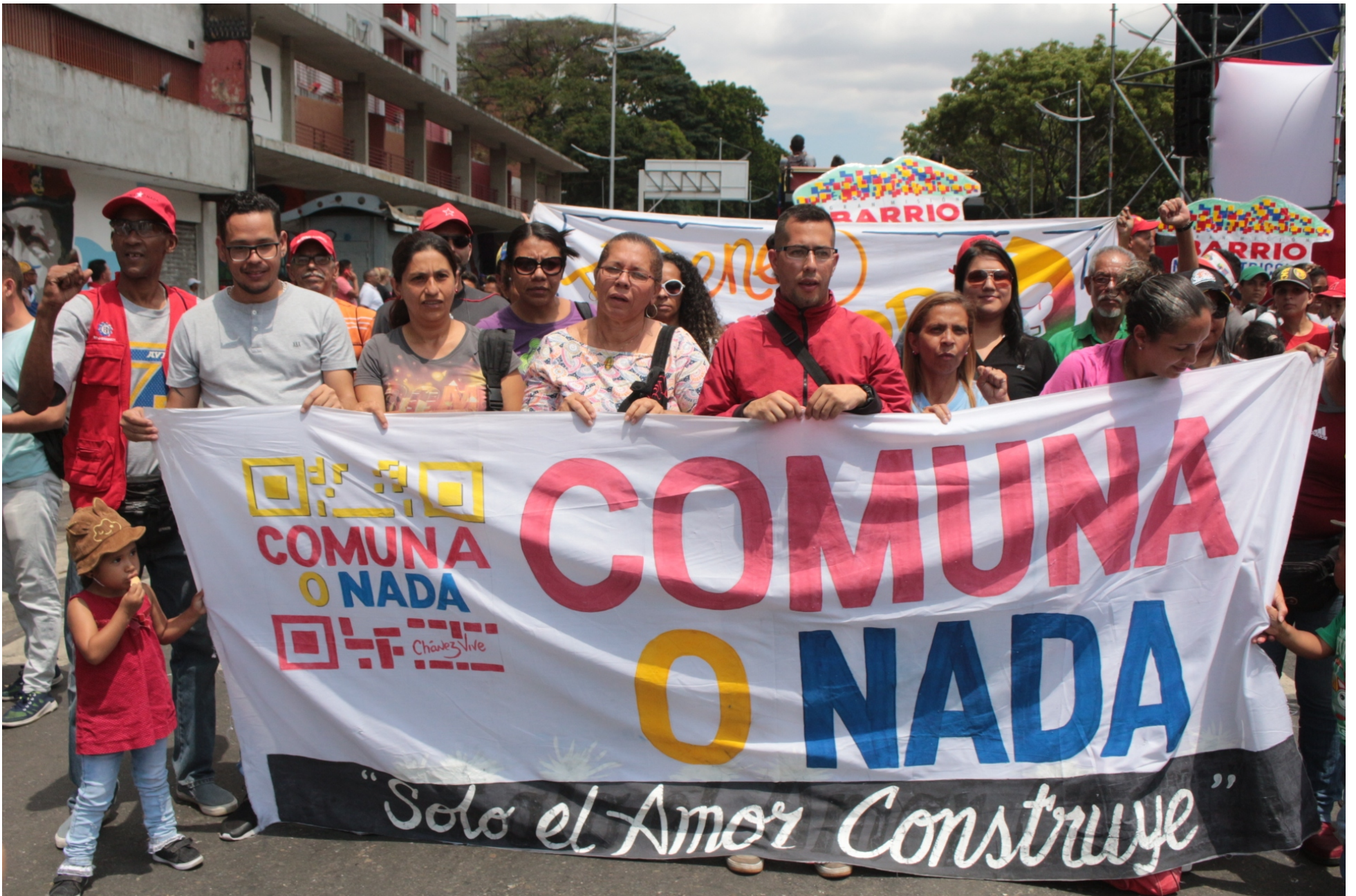
El poder de las Comunas es el eje fundamental para sostener los avances de la Revolución a futuro.

estos materiales. Ya tenemos algunas experiencias pero aún nos falta mucho. La clave del modelo es la autoorganización de los Comités, para que puedan realizar su propia recolección diferenciada, generar su propio espacio para el almacenamiento, la transformación y el procesamiento de materiales a pequeña escala, en base a técnicas ya probadas en algunos territorios comunales.