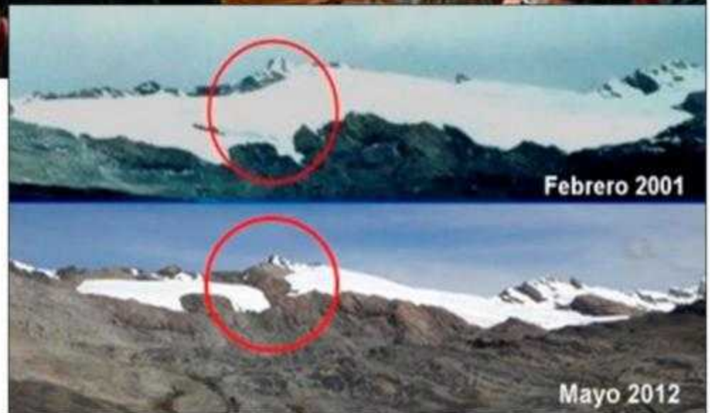
El Nevado Huáscarán de 4,800m.s.n.m. prácticamente sin nieve

En ese marco se llevó a cabo la Cumbre Anual de la Convención Marco de las Naciones Unidas sobre el Cambio Climático (CMNUCC) a inicios de noviembre del presente año. En esta oportunidad la XXVI Conferencia de las Partes de la Convención de Cambio Climático denomi-