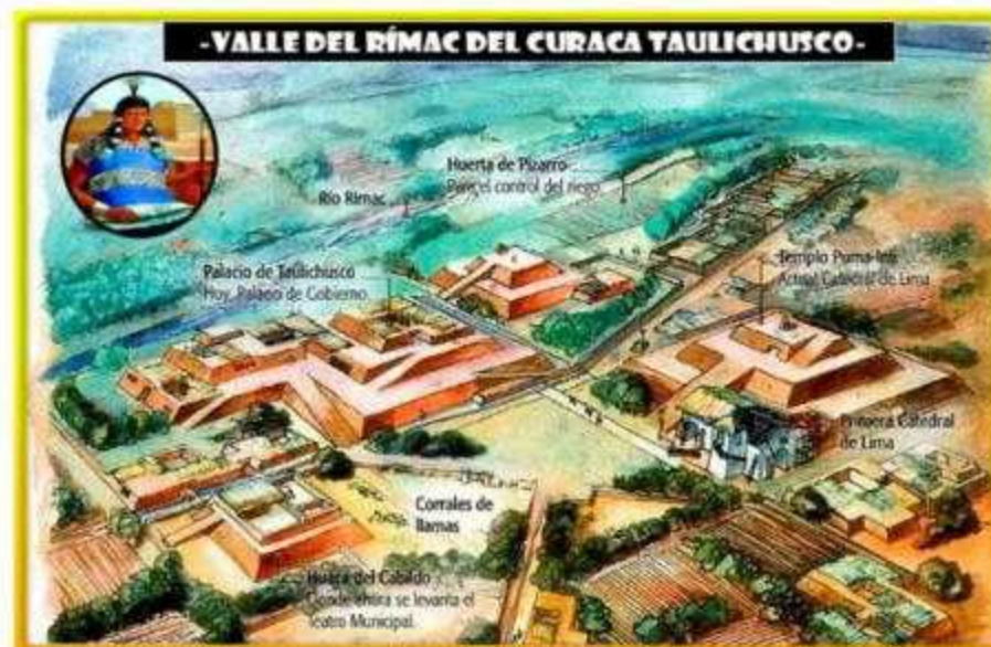
El Valle de Lima y las tierras de cultivo se reemplazaron por el cemento

Terminamos esta primera entrega, citando a Sebastián Salazar Bondy, escritor, ensayista, "... Lima fue fundada. Mucho antes, sin embargo, en el lugar donde está emplazada vivían esos hombres cuyos restos han sido desenterrados de los cementerios de Huallamarca o Armatambo, a quienes muy pocos osan llamar limeños, pues tal privilegio solo se concede a los que nacieron en la ciudad dibujada un cálido día de enero por la espada de Francisco Pizarro." (Del clásico LIMA LA HORRIBLE, de Sebastián Salazar Bondy, que allende Lima, está obligado a Leer).