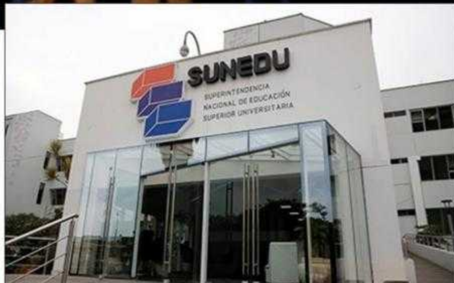
La Sunedu no ha podido resolver el tema de la autonomía universitaria ni garantizar una mejor formación profesional.

En cuanto al estratégico rubro de la investigación el panorama responde al contexto nacional: una limitada producción científica, reducido fomento e incentivos a la investigación científica, etc. El resultado, son muy escasas las universidades peruanas que figuran en los rankings latinoamericano y mundial. Sólo 3 aparecen: San Marcos, la PUCP y la Cayetano. Y esto