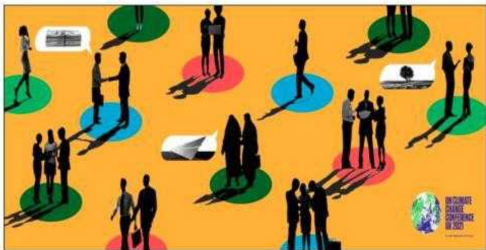
Cientos de autoridades de Estado, empresarios y sociedad civil participaron en la Cob 26

un final de infarto extendiéndose las discusiones hasta el sábado 13, llegando al acuerdo inicial para establecer una agenda global contra el cambio climático para la próxima década. Un acuerdo al que llegaron sin precedentes fue considerar al carbón como la principal fuente del calentamiento global y existe un compromiso para reducir su uso. La India, el tercer país con 6% de emisiones a nivel mundial, al final propuso que no se firmara el término de eliminación gradual de su uso como fuente de energía, lo que llevó a un debate adicional con posiciones muy contrarias alcanzando apoyo de los países en vías de desarrollo. También se aprobó un compromiso para imponer metas más estrictas contra la quema de carbón el año entrante. Así mismo se insta a los países desarrollados para que dupliquen sus provisiones colectivas de financiación dirigidos a los países en vías de desarrollo para adaptarse al cambio climático hacia el 2025. Otros aspectos que se acordaron fueron respecto al metano, la deforestación y la descarbonización de los países industrializados para reemplazarlos por tecnologías más limpias, saludables y sostenibles. Pero los lobbies de los países desarrollados en esta cumbre fueron muy notorios al no