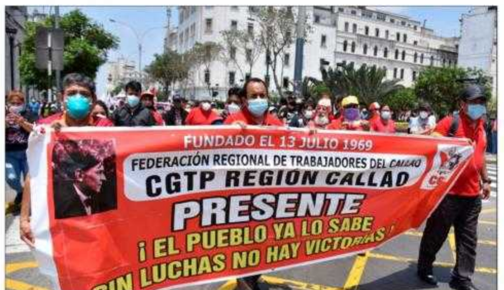
En la movilización también estuvieron los sindicatos de la CGTP Callao reafirmando su combatividad y lucha