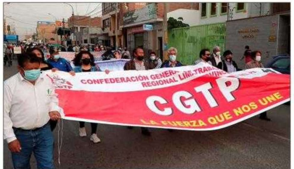
Las bases de la CGTP de Lima Provincias estuvieron en la movilización

Castillo y su partido político Perú Libre han llegado al poder del Estado; pero las fuerzas de oposición ya han planteado su vacancia. En esas condiciones Castillo, para conservar su gobierno no deberá negociar y conceder en su programa, a favor de las fuerzas de derecha y en perjuicio de la población que le otorgó su voto.