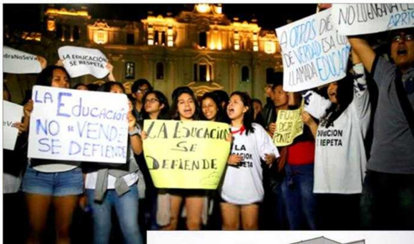
Los estudiantes no quieren regresar al pasado de la ANR pero sus problemas no están solucionados

nimizar costos y maximizar utilidades a costa del trabajo docente. La precarización del trabajo, incremento de las matrículas, y una Constitución que le garantiza granjerías tributarias explican sus cuantiosos dividendos. En este caso así como en la aplicación del artículo 96 de la Ley Universitaria que dispone la homologación de los sueldos de los docentes con los de los magistrados del Poder Judicial la Sunedu brilla por su ausencia.