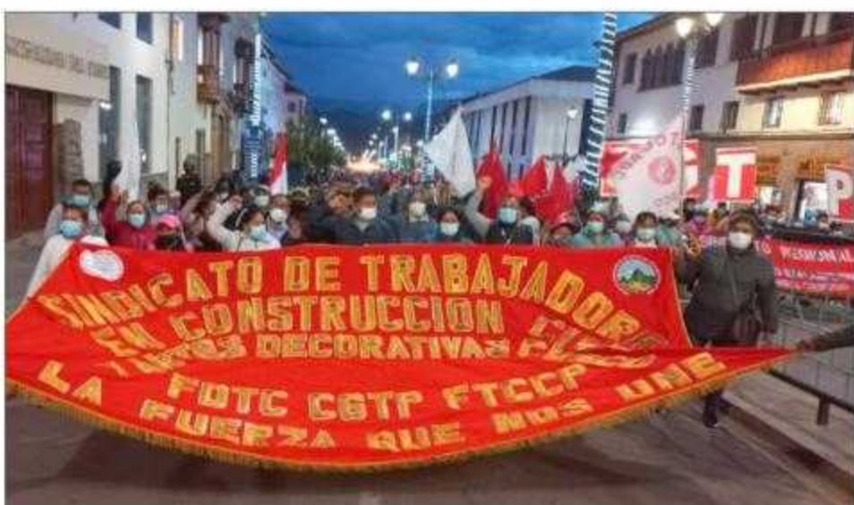
La FDTC también salió a las calles en rechazo al golpismo de la ultraderecha. ¡Cusco rojo siempre será!