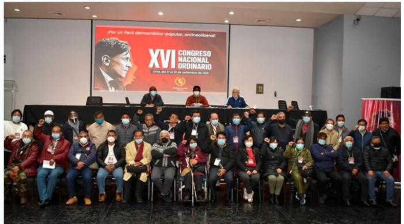
El exitoso XVI Congreso Nacional del PCP fue el paso histórico necesario para transformar el partido, en un partido de cuadros y de masas y ser el instrumento para la revolución.

El Congreso del PCP ratificó también que la prioridad es la construcción orgánica del partido, lo que significa la incorporación de nuevos militantes en la filas del partido de Mariátegui, de Jorge Del