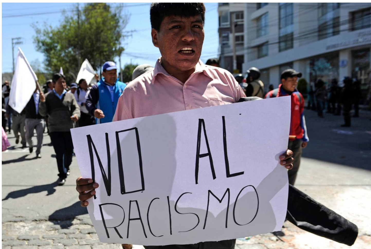
“La causa justa del indígena es la de todos los bolivianos.”

Hay muchas formas de racismo en el mundo, pero ninguno como el que se practica en Bolivia, donde es institucionalizado, de origen religioso, tenazmente encubierto y defendido. Es tan poderoso su mecanismo de opresión, que después de cinco siglos de haber postrado al indígena, éste sigue viviendo como elefante de circo, sin saber lo poderoso que es, con relación a la cadenita que lo sujeta de una pata. La espada y la cruz son los dos elementos claves de este método de dominación, pero antes de iniciar el análisis, es pertinente aclarar que la palabra "blanco" no será usada solo en referencia a blancos de raza, ni de piel, sino más que todo de conciencia. Se refiere a seres humanos obviamente mestizos, que se creen blancos y detestan al indígena.