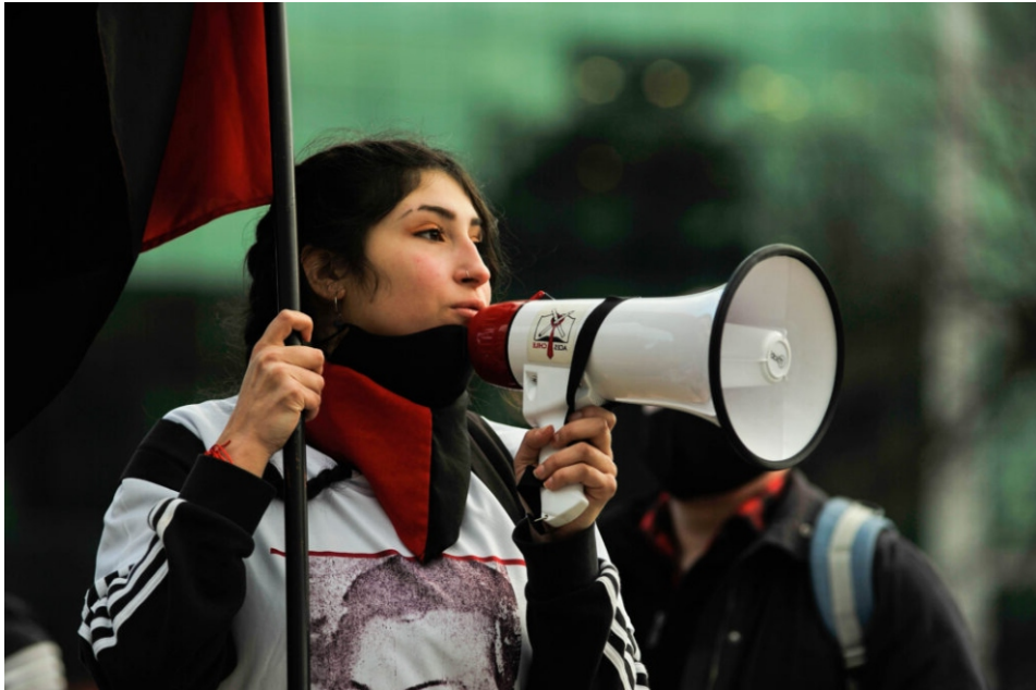
Una de las jóvenes que luego de hablar fue reprimida y detenida por los Carabineros.

El pasado 11 de septiembre la Asamblea Coordinadora de Estudiantes Secundarios de la Araucanía y la Agrupación de ex Prisioneros Políticos de la Araucanía, convocaron a una marcha para recordar a las víctimas de los crímenes de lesa humanidad