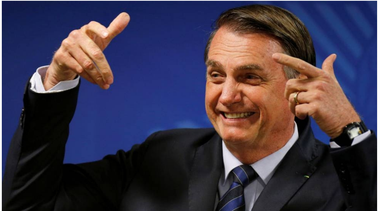
Bolsonaro y un gobierno que está en contra de la vida en toda su extensión

El gobierno de Bolsonaro no se limita a oscilar entre cerrar los ojos frente a las acciones criminales contra el medioambiente e incentivar, por su inacción o directamente, criticando medidas y leyes protectoras, el avance criminal sobre la naturaleza: también actúa.