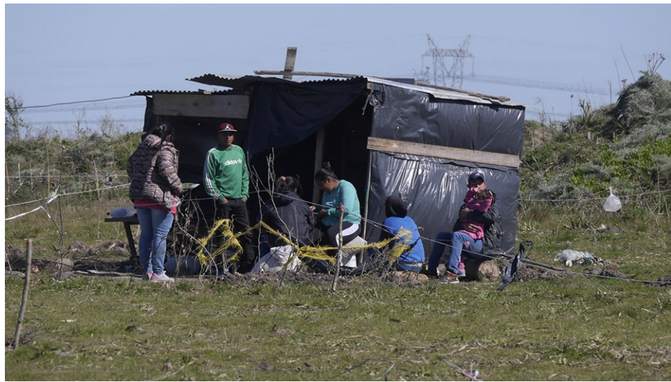
La toma de tierras de Guernica se convirtió en símbolo de resistencia popular.

Tenemos una "República" construida de acuerdo a los principios y valores de la modernidad colonial. Eso se hizo, una vez derrotada a sangre y fuego- la perspectiva de la Patria Grande, bajo la dicotomía de "civilización o barbarie".