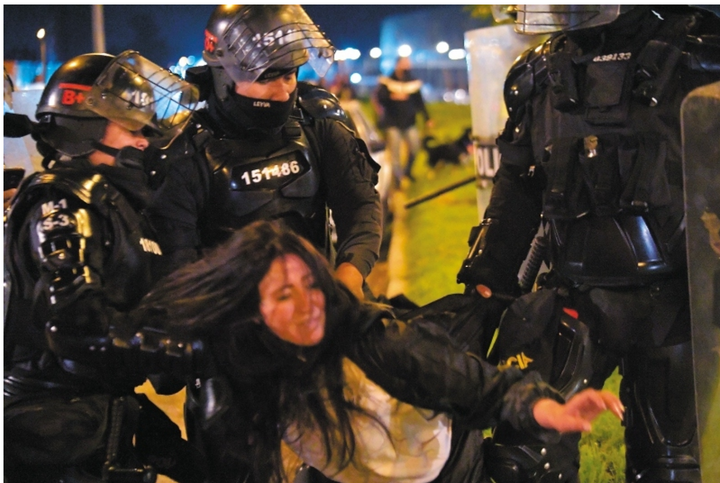
La policía colombiana es cada vez más odiada por la población debido a su brutalidad represiva.