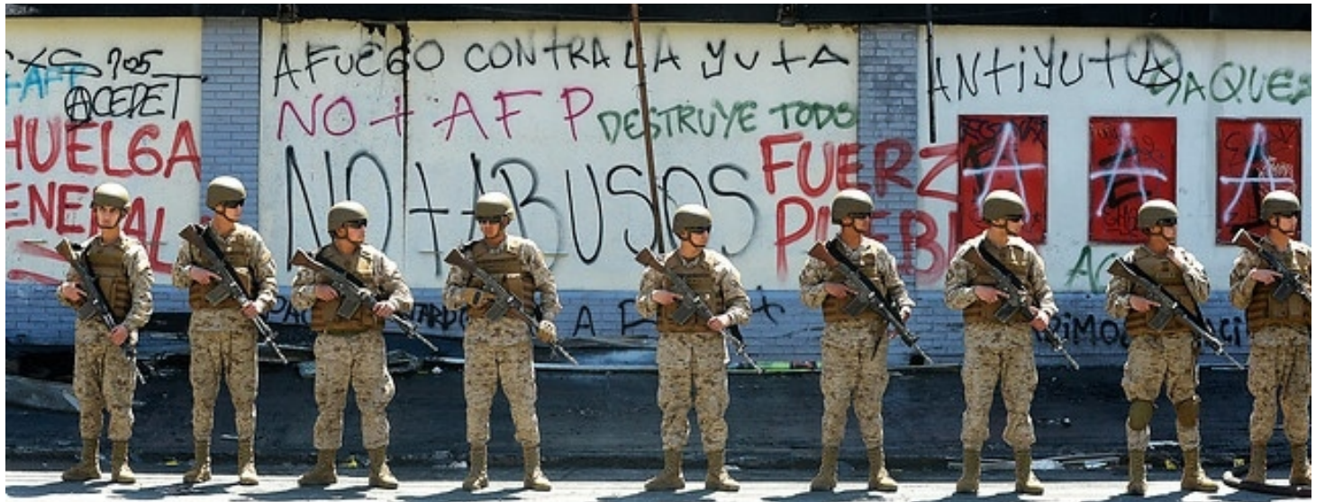
Los militares chilenos están acusados, junto a los Carabineros, de verdaderas atrocidades represivas.

Por un lado, el gobierno se jacta de que varias comunas del país han presentado una evolución positiva y reabren el comercio. Incluso se decretan normas excepcionales para salir en las "Fiestas Patrias". Sin embargo, dice el gobierno, es necesario mantener el Estado de Excepción porque la pandemia aún no está controlada, y para ello, es necesario mantener militarizadas las ciudades. Como si un virus se pudiera hacer desaparecer con fusiles, así como lo hicieron con miles de personas. Más bien se asemeja a un amedrentamiento implícito o acaso para fiscalizar la