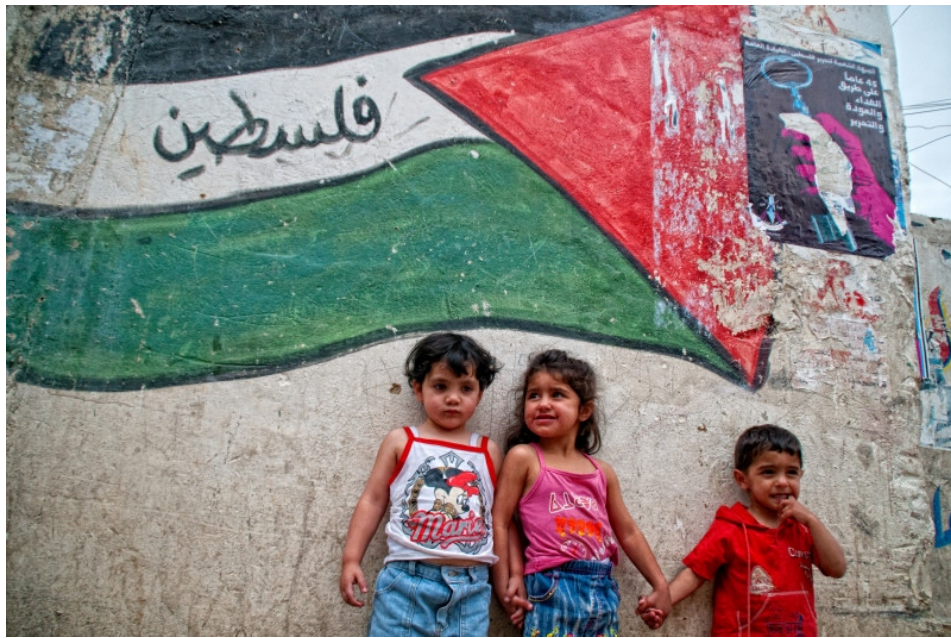
Niños y niñas palestinas serán la nueva camada de resistentes.

Las ONGs y la Federación de Sindicatos firmantes representan prácticamente al conjunto de la