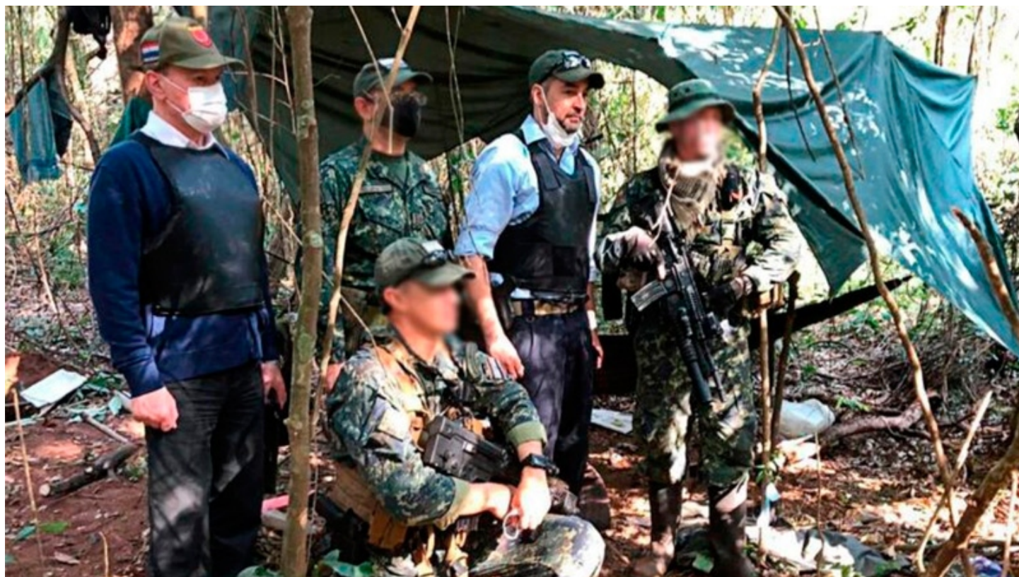
El presidente Mario Abdo Benítez junto a los asesinos de las dos niñas argentinas.