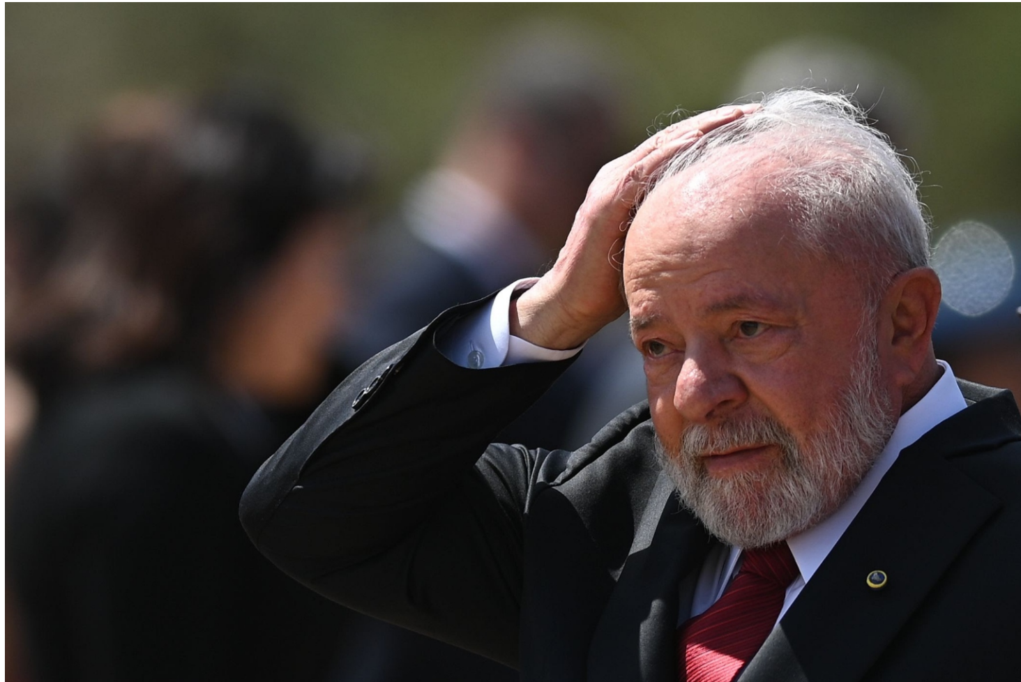
Cambiar Brasil no es posible sin desafiar esta dependencia.

¿La fracción liberal que se desvinculó del bolsonarismo conquistó una hegemonía "duradera" sobre la clase dominante?