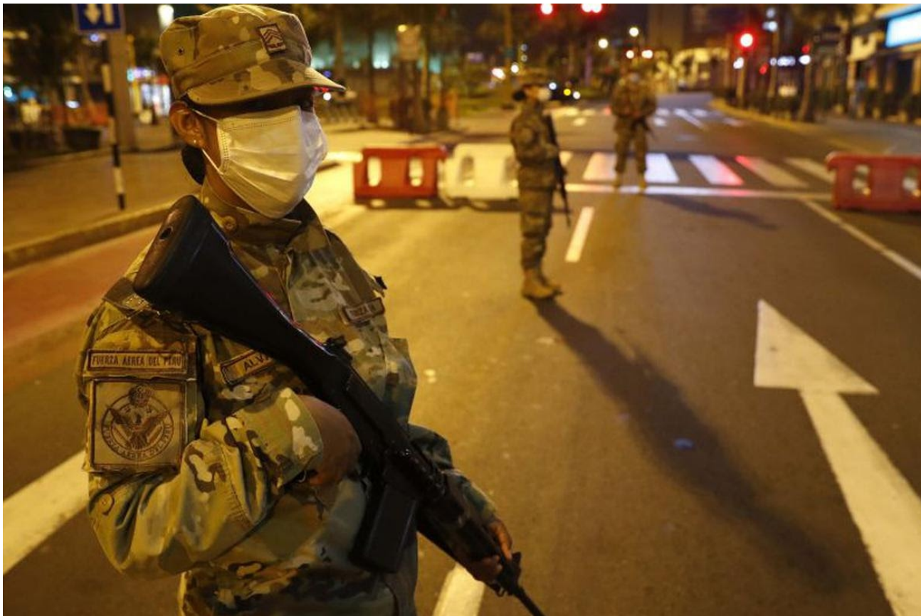
La dictadura peruana proyanqui y su escalada represiva como reaseguro para seguir en el poder.

La expresión es cabal: Terrorismo de Estado. Solo así se puede aludir a lo que está ocurriendo en el Perú de hoy. Pero la historia tiene funestos y trágicos antecedentes. Veamos.