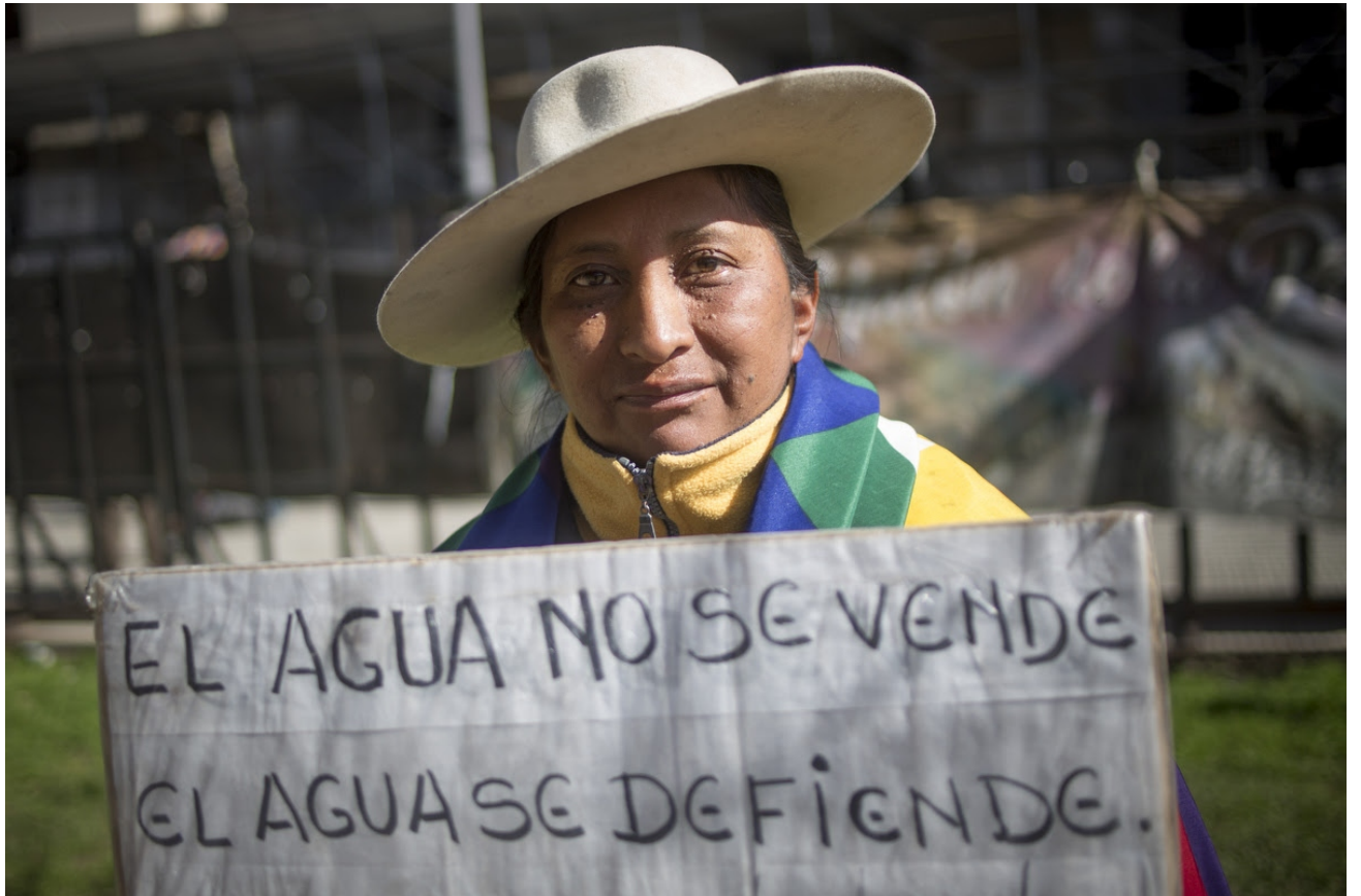
El Tercer Malón de la Paz, un hecho histórico a pesar del ninguneo oficial y del odio de la derecha.

-No tenemos expectativas, es lo mismo que