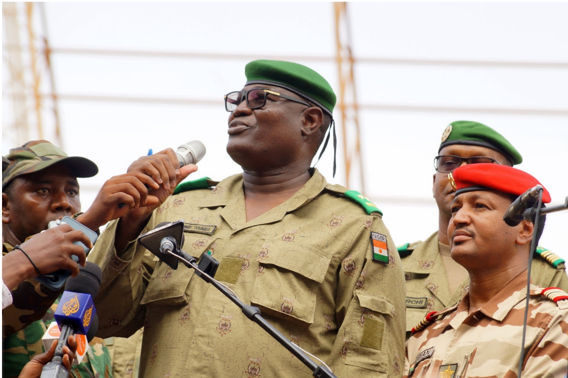
Abdourahamane Tchiani, jefe militar del levantamiento revolucionario en Níger: África se convierte en esperanza.

Níger es un país del centro-oeste de África y como la abrumadora mayoría de ese continente sufrió el colonialismo, la esclavitud y el saqueo de las potencias europeas y posteriormente de Estados Unidos. El Reino Unido, Francia, Bélgica, Holanda, Alemania e incluso España clavaron primero sus colmillos en ese continente. El imperialismo yanqui, que se favoreció con la mano de obra esclava llegada de aquellos confines, luego se metió en el reparto Del botín africano.