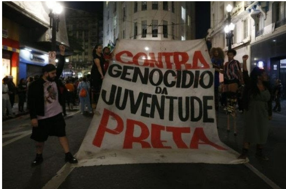
La juventud denuncia la política genocida de sectores policiales.

Por Rosangela Cristina Martins y Jaime A Alves