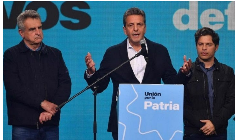
Massa, un candidato "popular" que hambrea al pueblo: le puso la alfombra roja a la victoria derechista.

Lo que queda a la vista es que con cambio o sin cambio de signo político, es el FMI quien continúa al