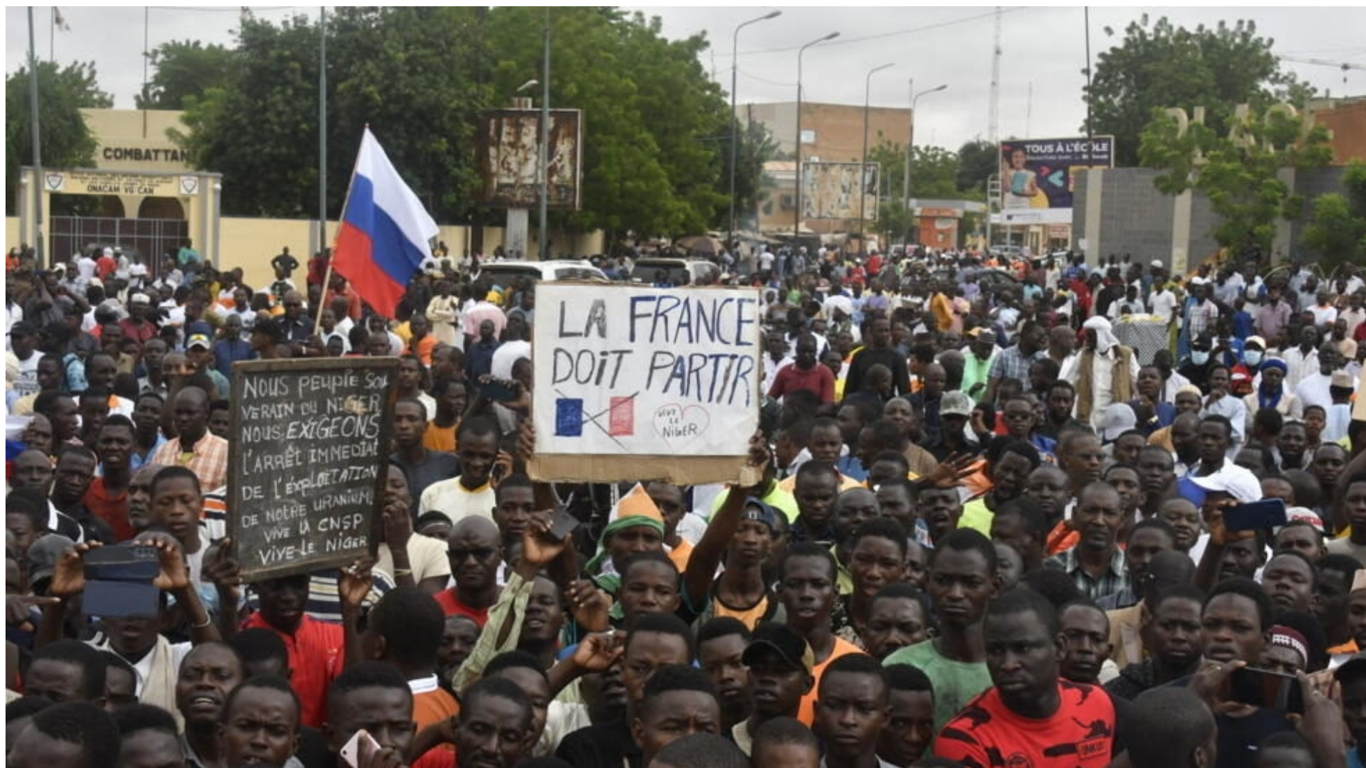
El pueblo nigerino apoya desde el primer momento el levantamiento militar y resistirá cualquier tipo de intervención extranjera.

empobrecía mientras Areva/Orano crecía hasta convertirse en una de las multinacionales mineras más grandes del mundo. El tamaño de la empresa francesa es casi el doble de toda la economía de Níger.