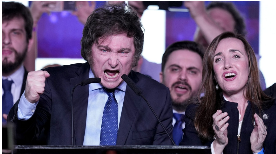
La ultraderecha festeja y amenaza.

En un país con enorme cantidad de trabajadorxs registrados que viven bajo la línea de pobreza, en el que aún no se ha difundido la autopsia definitiva del militante internacionalista inducido a la muerte por la policía metropolitana durante una protesta contra la farsa electoral, y donde la izquierda parlamentaria a estas horas debe estar preguntándose si las redes sociales terminaron por imponerse sobre el puerta de fábrica, las Primarias Abiertas Simultáneas y Obligatorias (PASO) dejan el saldo de más de 11 millones de argentinx que no fueron a votar, hartos de las reglas de juego vigentes en una democracia sin equidad índice que debe sumarse a los más de un millón de votos anulados -; un candidato ultraliberal que varias encuestadoras