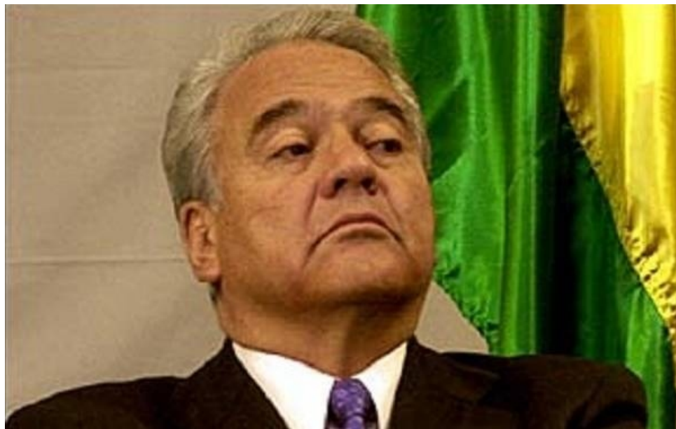
Sánchez de Lozada, el ex presidente que se jactaba de hablar en inglés en actos oficiales.

Con el propósito de ordenar la agenda política boliviana e impulsar un proyecto de restauración neoliberal y oligárquico, en la perspectiva de constituir una candidatura unitaria para las elecciones de 2025, Gonzalo Sánchez de Lozada ha convocado a las fuerzas políticas y dirigentes opositores al Movimiento Al Socialismo (MAS) a acercar posiciones bajo la consigna de impulsar una nueva Constitución Política del Estado de carácter neoliberal y republicana que reemplace a la actual plurinacional.