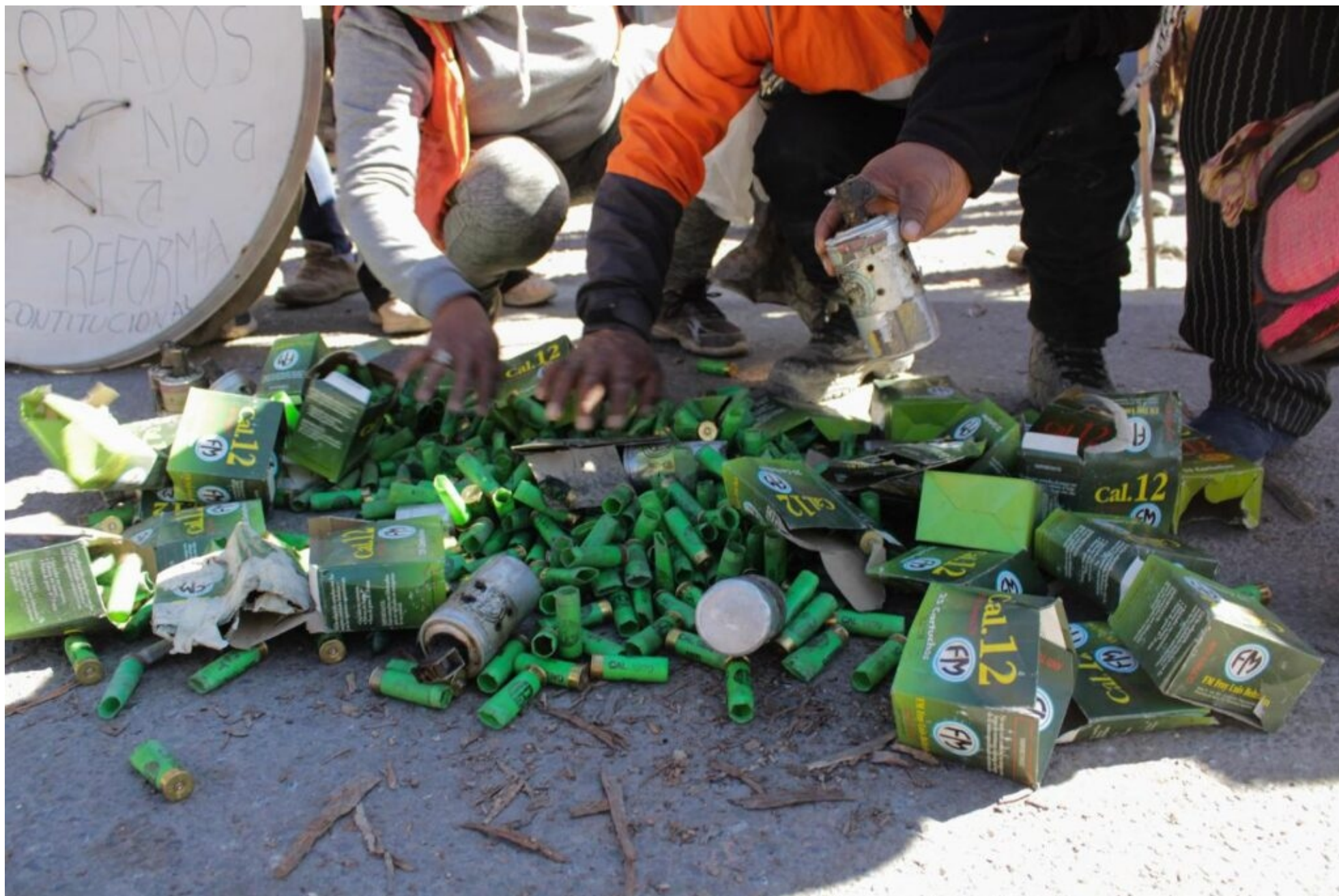
Los cartuchos que la policía arrojó sobre los manifestantes, quitándole un ojo a varios jóvenes.

Los sectores que están involucrados con la actividad turística, porque la quebrada de Humahuaca ha sido declarada Patrimonio de la Humanidad desde el 2003, casualmente en este mes de julio, el 2 de julio se celebran 20 años de la declaración de Patrimonio de la Humanidad. Esa declaración implicó realmente un salto en el desarrollo del turismo en la región. Un salto porque se declara por su carácter de natural y por su cultura, y ambas cosas se complementan, porque aparte de la belleza paisajística está el valor intangible de la gente, cómo mantiene una pauta cultural precolumbina intacta, viva la mantiene.