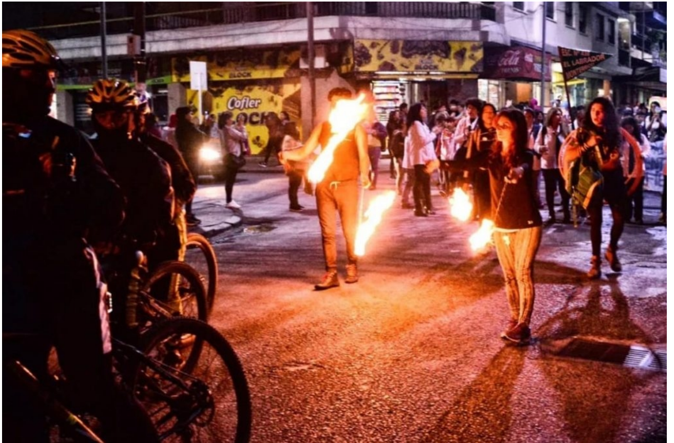
Manifestación de gente de la cultura contra Gerardo Morales.

Camila cree que el ataque duró poco más de media hora. Luego, soltaron el cable que tenía en el cuello y le arrojaron las llaves de su casa. "Cerraré la puerta con llave, mamita que hay mucha gente mala dando vueltas", le dijeron. «Hay muchos piqueteros», agregó él. Y rieron. «Una de las últimas veces que este hombre me