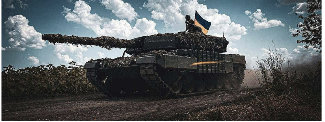
Son los tanques rusos los que están dando fuerte batalla en la guerra contra la OTAN y el nazismo de Zelensky y compañía.

Ese es también el discurso de Valery Zaluzhny, el comandante en jefe de las Fuerzas Armadas de Ucrania que ya obtuvo una portada en la revista Time , que le dio el calificativo de héroe, y al que The Times calificó de general Jedi . Gran parte de su narrativa es la lucha contra el legado soviético en el ejército ucraniano, una modernización estética que, en su caso, se traduce en la inclusión de todo tipo de parafernalia banderista. Esa lucha contra el legado soviético no es solo interna sino también externa. "Tras la lucha contra el enemigo ideológico soviético interno", afirma The Washington Post normalizando completamente como soviético cualquier alternativa a la OTAN,