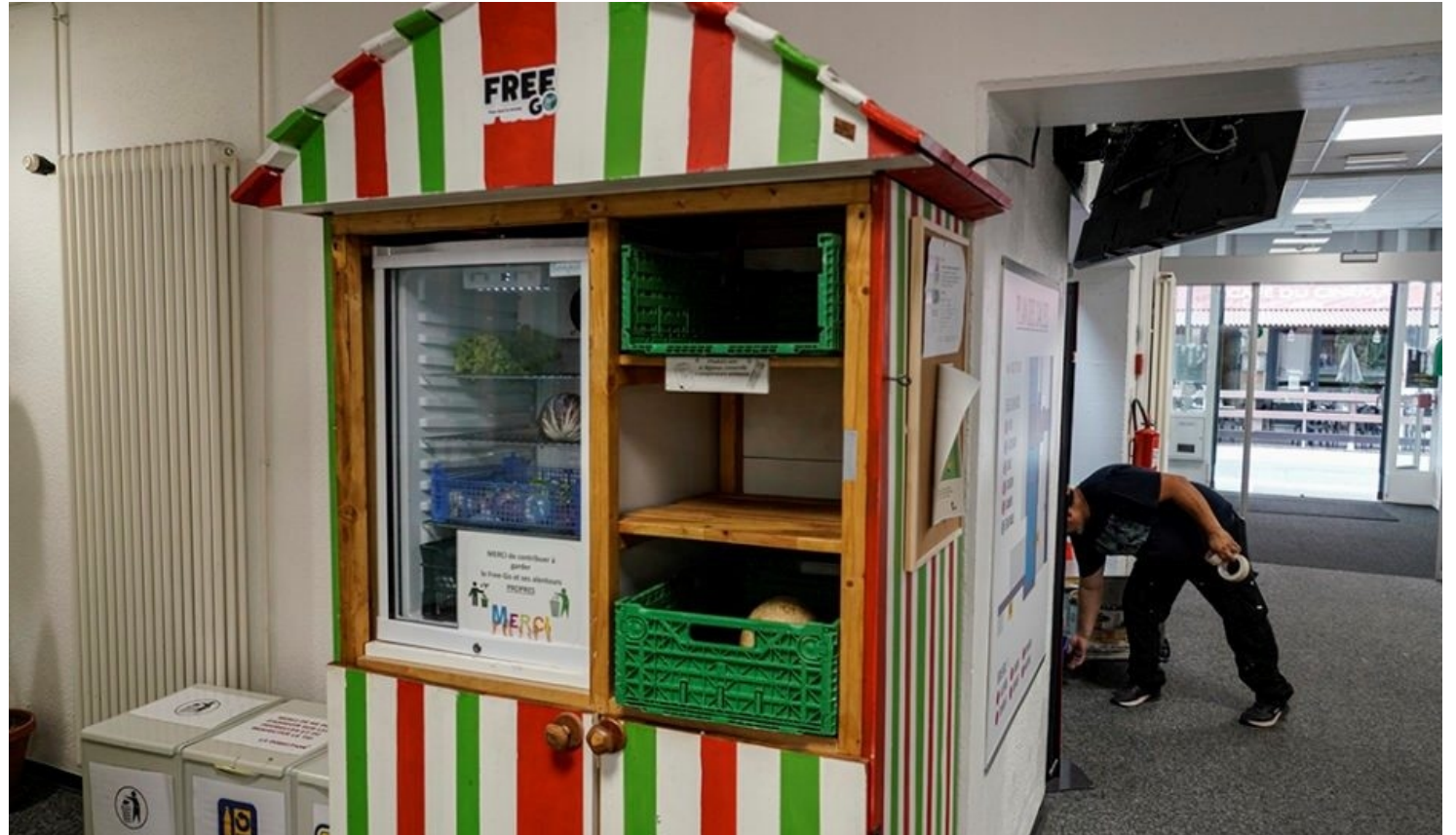
"Free go" y una forma sencilla y solidaria de acercar alimentos a los sectores populares.

proyecto Äss-Bar (que en dialecto suizo alemán significa "Se puede comer") que reintroduce el pan y la repostería del día anterior en el circuito de consumo. Los productos se recogen por la mañana en las distintas panaderías asociadas situadas en las proximidades de los siete puntos de venta todas coquetas, estilo boutique con que cuenta Äss-Bar en las principales ciudades ( https://www.aess-bar.ch/shop/stores.php ).