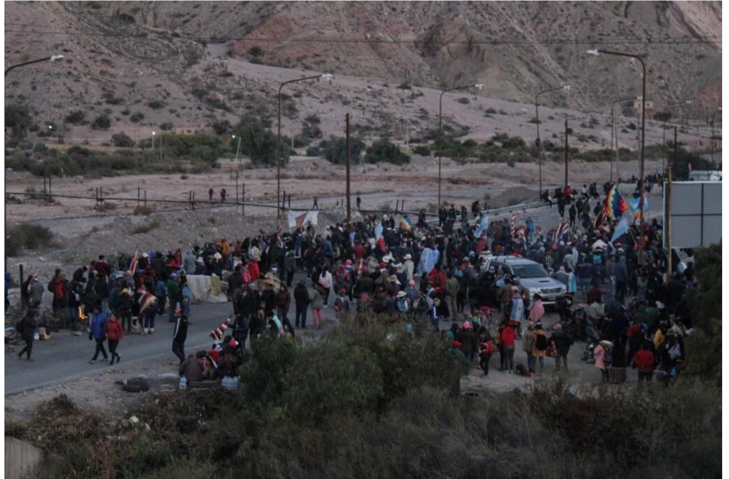
No hubo un solo día sin que el pueblo no se movilizara en los cortes de Purmamarca o en Abra Pampa.

-Esta asamblea del Tercer Malón de la Paz con sede en Purmamarca, la integran todas las comunidades que voluntariamente están en este espacio, que provienen de las regiones puna, quebrada, valles y yungas. Son las cuatro regiones identitarias de Jujuy. En esta distri-