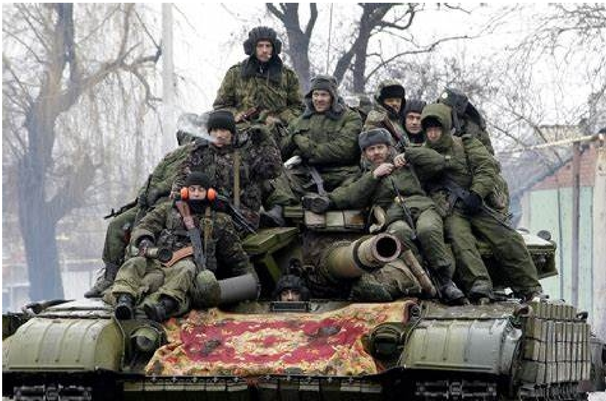
Las tropas rusas siguen avanzando y cumpliendo con sus objetivos, a pesar de las repetidas acciones del terrorismo ucraniano.

El tiempo pasa y continúan proliferando los artículos que explican por qué la ofensiva ucraniana no ha avanzado según el ritmo esperado y justifican la esperanza que hay que mantener en la capacidad de Ucrania de lograr sus objetivos en el cambio de táctica que observan en los últimos tiempos. El más reciente ha sido publicado por The New York Times, que, aunque siempre desde la voluntad de hacer ver unas dificultades superables y una ofensiva que finalmente ganará impulso, da ciertos datos relevantes para comprender el desarrollo de los acontecimientos. Desde que se anunció la preparación de la ofensiva, cuya dirección solo podía ser el frente de Zaporozhie hacia Crimea, por lo que no hubo ninguna intención de ocultar los objetivos, las armas occidentales han sido el principal argumento ucraniano para construir una narrativa de victoria segura.