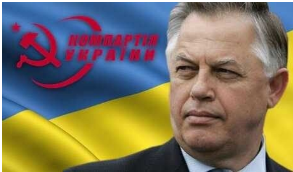
Secretario general del Partido Comunista ucraniano Piotr Simonenko.

Discurso del Primer Secretario del Partido Comunista de Ucrania, Piotr Simonenko, en el XXII Encuentro de Partidos Comunistas y Obreros, La Habana (Cuba), octubre de 2022.