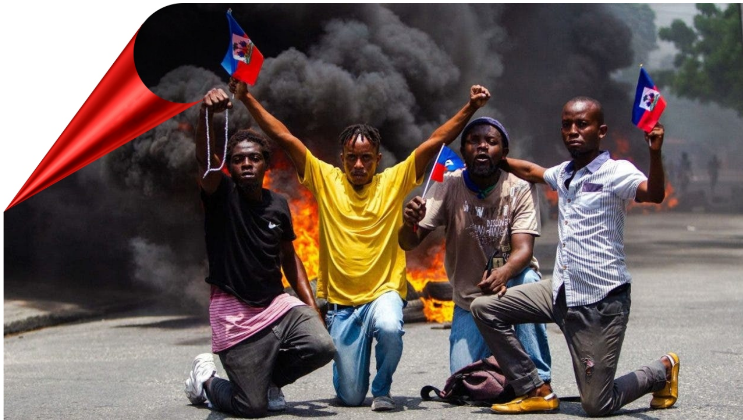
El legado del héroe nacional Dessalines vive en la insurrección actual del pueblo haitiano.

Los ciudadanos del país han tomado las calles de todo el país para protestar por su frustración ante la miseria económica: la inseguridad alimentaria; aumento de la inflación; altos precios y escasez de combustible; Y el fin de la injerencia e intervención extranjera en los asuntos internos de la nación.