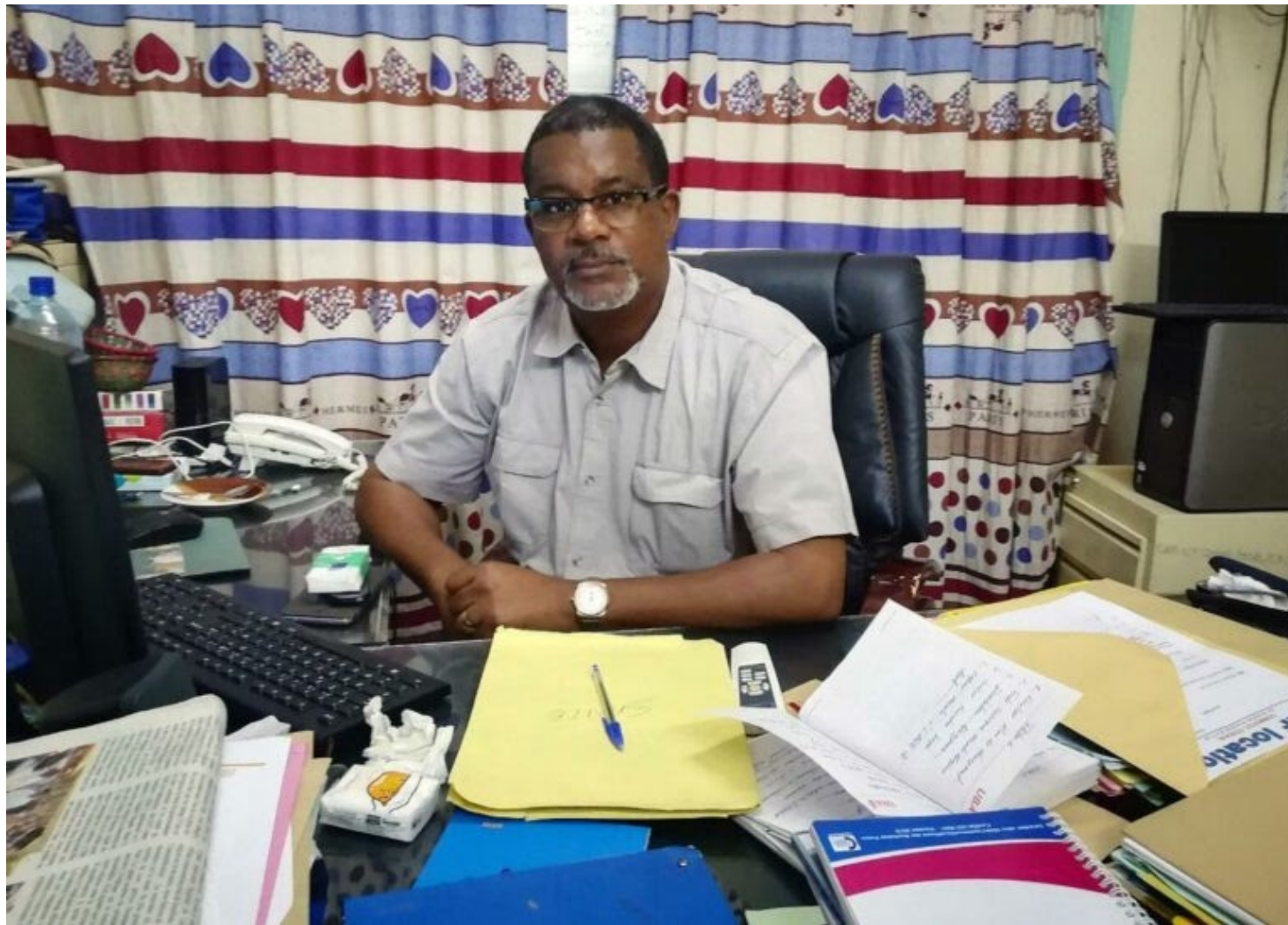
El cineasta africano Abdoulaye Diallo, uno de los grandes teóricos de la descolonización en ese continente

El cofundador del Festival de cine burkinés Droit Libre, viajó al Festival Internacional de Cine del Sahara Occidental (Fisahara) donde pudo conversar sobre descolonización cultural y panafricanismo.