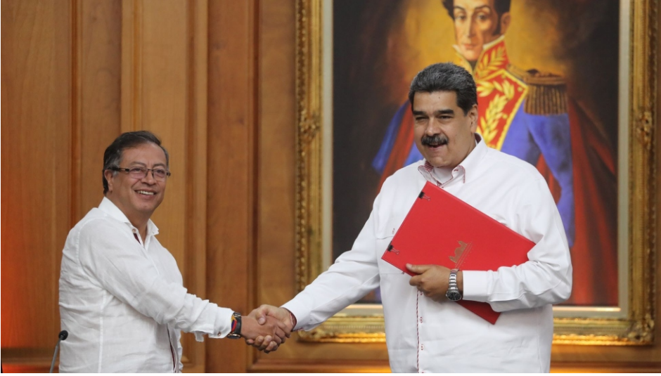
Gustavo Petro y Nicolás Maduro, cuando el primero visitó Caracas para restaurar las relaciones

dad, pero debo decir que ha habido algunos planteamientos que no comparto. Ante todo, reitero que aprecio y valoro su gran esfuerzo y decisión para restablecer al más alto nivel los vínculos entre nuestros países, sin embargo no puedo estar de acuerdo con algunas ideas que Usted ha emitido y que lo colocan en el umbral de la injerencia.