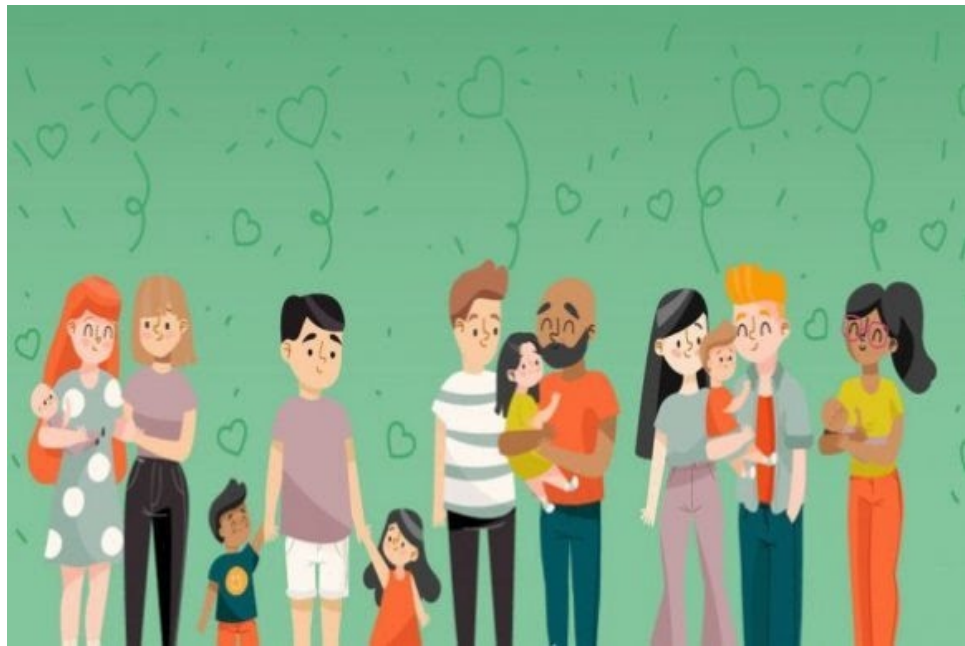
Imagen para ilustrar el nuevo y revolucionario Código de las Familias.