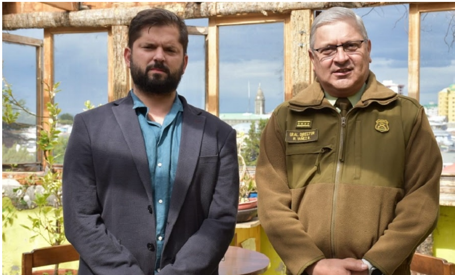
Boric y el General Ricardo Yañez, jefe de los Carabineros que asesinaron a tantos jóvenes y que hoy siguen golpeando con impunidad.

Uno de los mayores peligros para los pueblos y los trabajadores es cuando el fascismo, las políticas reaccionarias se visten de izquierda y de progresista. La confusión reina por ello en los explotados ya que estos traidores recurren al discurso histórico de la izquierda cada vez que requieren fortalecer su opción pro capitalista y burguesa.