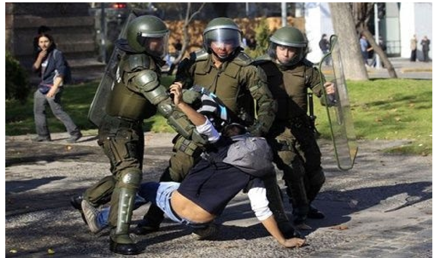
Hacer apalear a los Mapuches y a los estudiantes secundarios: balance de la gestión del "progresista" Boric.

Por otro lado, Llao cuestionó la transversalidad del diálogo al que está arribando el Gobierno. "Él dice que se vino a reunir con las autoridades de la región, del Wallmapu, pero las autoridades nuestras son nuestros