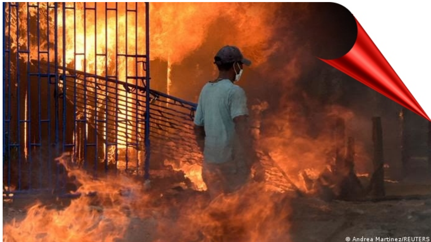
Atentados, palizas a los partidarios del gobierno e incendios de sedes de sindicatos, ese esa es la receta de la derecha.

La falta de abastecimiento en Santa Cruz y la muerte lenta del comercio, está generando un descontento generalizado del pueblo cruceño, con un quiebre del bloque Cívico radical y Empresarial. Como respuesta política, se tiene que utilizar las Redes Sociales, para cercar la postura conservadora de la elite cruceña, que manipula y controla el actuar de varios cruceños, es necesario liberar al pueblo cruceño de las cadenas mediáticas y de manipulación que tienen por parte del poder de la burguesía cruceña. A la par, se debe mostrar a toda Bolivia que en Santa Cruz, la ambición de los Cívicos, a la cabeza de Rómulo Calvo y el Gobernador Luis Fernando Camacho y su postura regionalista y separatista, no es algo provechoso para el resto de los departamentos, ya que por ejemplo Potosí, nuevamente haciéndose utilizar por los cruceños, así como sucedió el 2019, en el Golpe de Estado, pretende iniciar un paro cívico con puntos de bloqueo. La pregunta que uno se hace: ¿será que los hermanos potosinos no piensan que adelantar el Censo al 2023 y la redistribución de escaños, no les