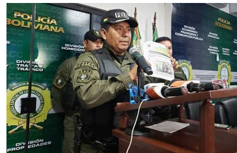
Oscar Gutiérrez, director Interino de la Fuerza Especial de Lucha Contra el Crimen en Conferencia de Prensa del 14/11/19 sobre el caso Facundo Molares.

«En definitiva, en base a su pasado como integrante de un grupo político y sin asidero fáctico, es acusado de forma oportunista, de pertenecer actualmente a un grupo armado,