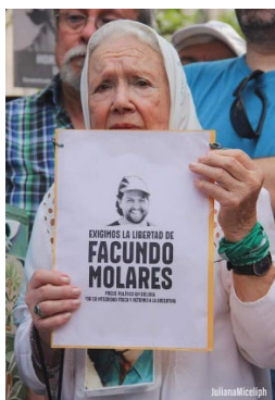
Norita Cortiñas, psicóloga social y cofundadora de Madres de Plaza de Mayo Línea Fundadora.

La familia y diversas organizaciones sociales, políticas y organismos de Derechos Humanos de Argentina y la región exigen su libertad y repatriación urgente a la Argentina para su atención médica y denuncian al gobierno de facto por detención irregular, inexistencia de imputación penal específica y violación al art. 8.2.b del Pacto de San José de Costa Rica.