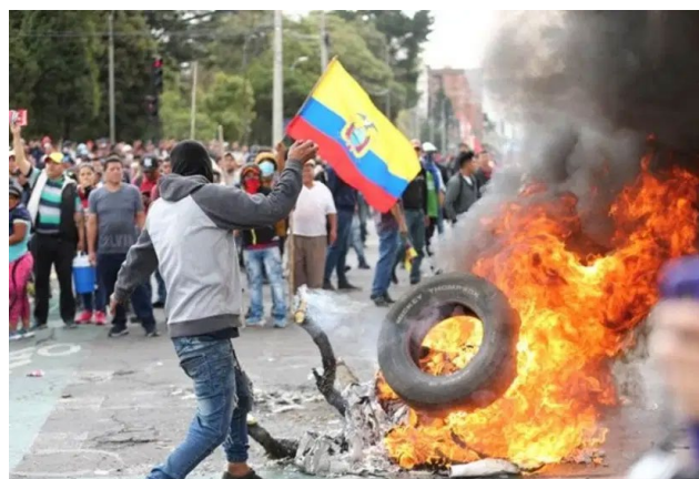
Ecuador entra en estado de excepción.

Hay una notoria persecución jurídica y un notable cerco mediático contra el correísmo; es más, todos los candidatos han coincidido en atacar con persistencia a Andrés Arauz.