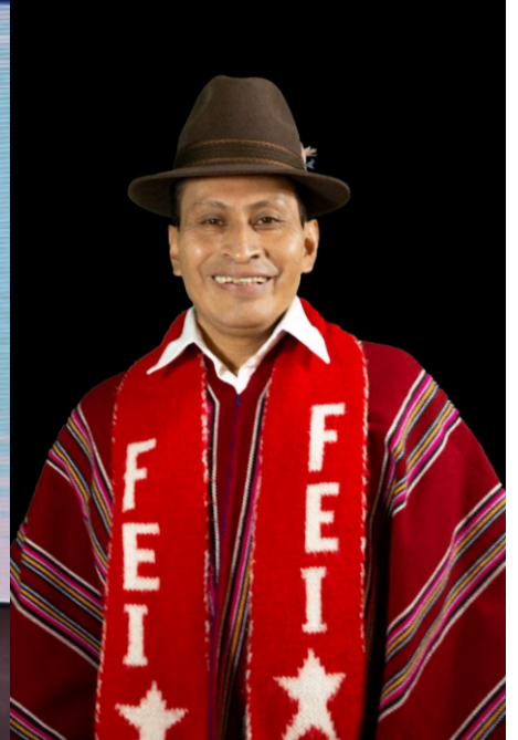
JOSÉ AGUALSACA GUAMÁM ASAMBLEÍSTA NACIONAL