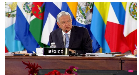
Andrés Manuel López Obrador Presidente de México

Y si bien inducir a los gobiernos neoliberales presentes a firmar la declaración final, que incluye temas como la deuda externa o el intercambio de vacunas, fue ciertamente importante, aún más importante es asegurarse de que no quede letra muerta. Y aquí la palabra pasa a la fuerza organizada y consciente del poder popular.