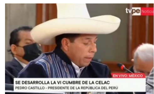
SE DESARROLLA LA VI CUMBRE DE LA CELAC PEDRO CASTILLO - PRESIDENTE DE LA REPUBLICA DEL PERÚ